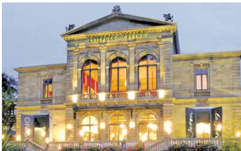
Die Bayerische Spielbank Bad Kissingen heute

Erwachsene Besucher haben zudem an diesem Tag Gelegenheit, zwischen 11 bis 14 Uhr den Roulettesaal zu besichtigen, während für Kinder und Jugendliche ein vielfältiges Programm geboten wird (Hüpfburg, Glitzer-Tattoos, Bootsfahren, Ballonmodellage etc.).