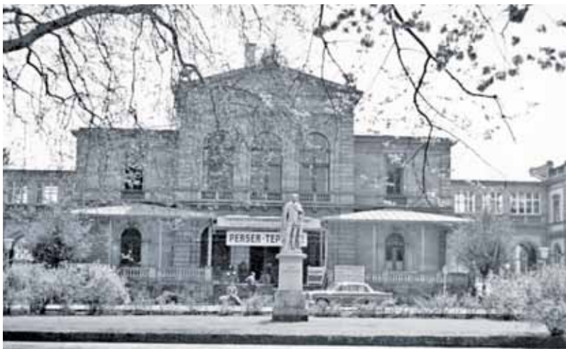
Das Luitpold-Casino beherbergte vor 1968 noch einen Teppichhandel