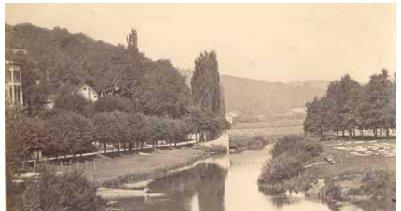
Bismarckstraße Blick Richtung Norden, um 1880.