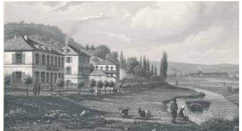
Bismarckstraße Blick Richtung Norden, um 1845.

Doch zurück zu den Referenzpunkten. Es handelt sich dabei um Bronzeplatten, welche an fünf ganz besonderen Punkten Bad