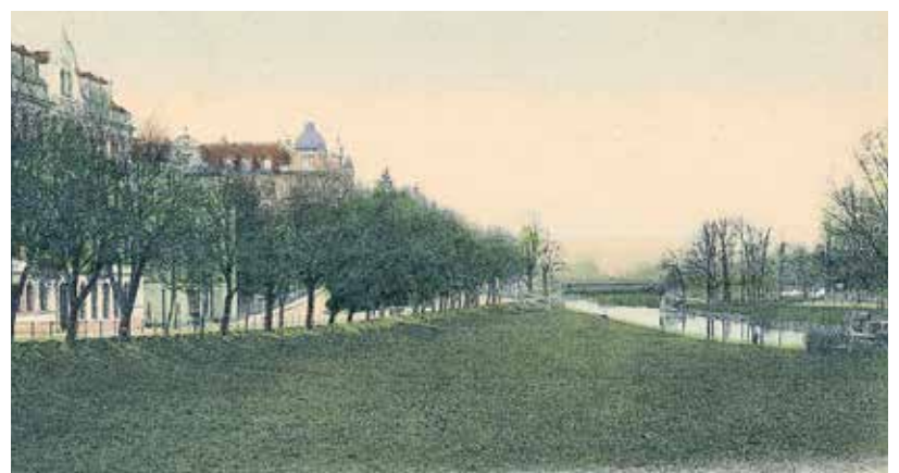
Bismarckstraße Blick Richtung Norden, um 1900.